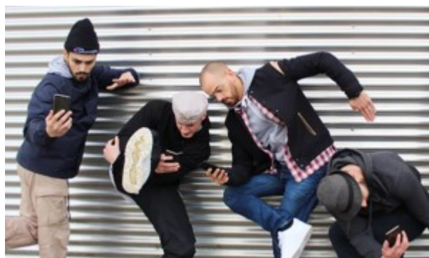
Déconnectés (DANSE) mise en scène : Cie MIRA