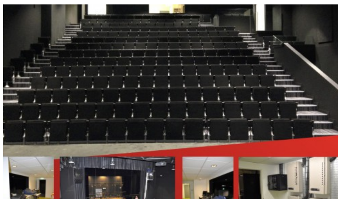
Gradins mobiles pour salle de spectacles et multi activités