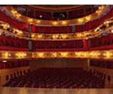
Théâtre à l'italienne